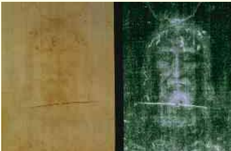
Amplificación de la imagen fotográfica-negativa del rostro del sudario

En el año de 1978 se les permitió a los científicos examinar la tela por primera vez. El resultado del examen fue que lo que parecía ser manchas de sangre resultó ser algo de color rojo descolorido, o un tipo de pintura, pero no sangre. La conclusión de los científicos fue que se había chamuscado algún tipo de imagen en la tela por el calor y presión, y entonces se pintó.